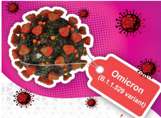
پای امیکرون به ساوه باز شد! شناسائی ۲ مورد قطعی امیکرون در ساوه

در شهر است. ایشان در ادامه ضمن اشاره به شناسائی مواردی از ابتلاء به کرونا در اراک، قم و تهران گفت مراوده مردم ساوه با این شهرها این در دسر را برای همشهریان ما ایجاد کرده است. همچنین به واسطه بارهایی که از جنوب کشور به شهرک شهرک صنعتی حمل می‌شوند ممکن است به واسطه آلودگی هرگزگان این محموله‌ها عامل انتقال باشد. سرپرست معاونت بهداشتی دانشکده علوم پزشکی ساوه ضمن انتقاد از میزان پایین رعایت دستورالعمل‌های بهداشتی نسبت به سایر شهرها در ساوه گفت با این سطح از رعایت دستورالعمل‌ها افزایش ناگهانی موارد ابتلاء به سویه امیکرون دور از انتظار نیست. وی در پایان سخنان خود ضمن دعوت از عموم مردم جهت رعایت دستورالعمل‌های بهداشتی، استفاده از دو ماسک، تهویه مناسب منزل و محل کار، رعایت فاصله اجتماعی و به طور ویژه تزریق دز سوم واکسن را از راه کارهای درامان ماندن در برابر امیکرون عنوان کرد.